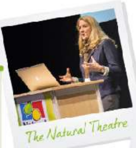
The Natural Theatre

Με την συνεχώς αυξανόμενη καταναλωτική ζήτηση στα vegan προϊόντα στην Σκανδιναβία, οι λιανέμποροι ψάχνουν να βρουν νέα καινοτόμα vegan προϊόντα.