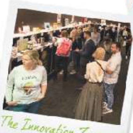
The Innovation Zone

Το εκπαιδευτικό πρόγραμμα του Natural Beauty Theatre θα φιλοξενήσει παγκοσμίως φήμης ομιλητές, με ποικιλία στην θεματολογία, όπως την καινοτομία και την ανάπτυξη προϊόντων, ευκαιρίες εισαγωγών και εξαγωγών καθώς και πρακτικές κατανόησης του κλάδου στις Σκανδιναβικές χώρες.