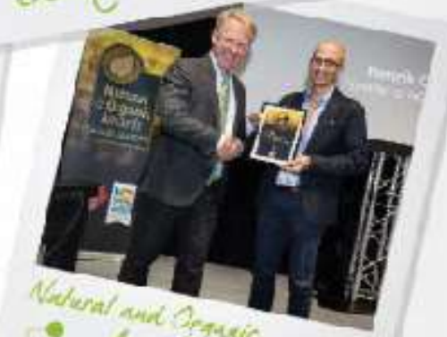
Natural and Organic Awards Scandinavia

Στο Innovation Zone οι εκθέτες θα εκθέσουν τα πιο πρόσφατα προϊόντα και στον ίδιο χώρο θα λάβει μέρος Natural & Organic Awards Scandinavia. Τα συγκεκριμένα προϊόντα θα υπάρχουν σε ξεχωριστό κατάλογο που θα μοιραστεί στους επισκέπτες της έκθεσης και θα προβληθούν στοχευμένα στα social media.