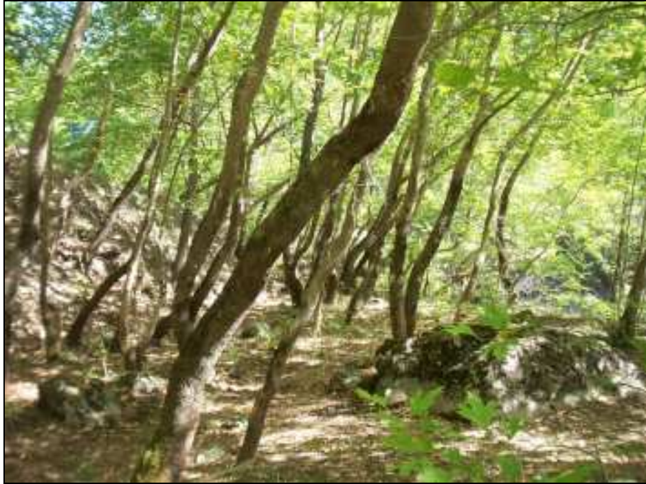
Φωτο. 3. Το πλατανοδάσος όπου θα κατασκευασθεί ο χώρος αναψυχής.