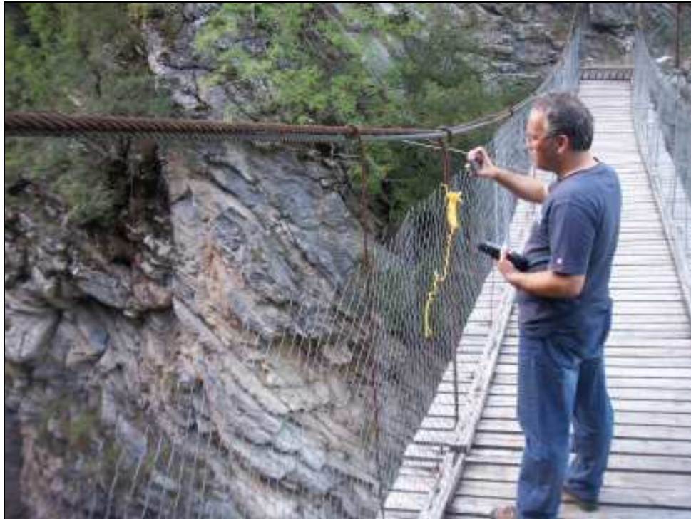
Φωτο. 7. Η κρεμαστή γέφυρα στη είσοδο του φαραγγιού Πανταβρέχει.