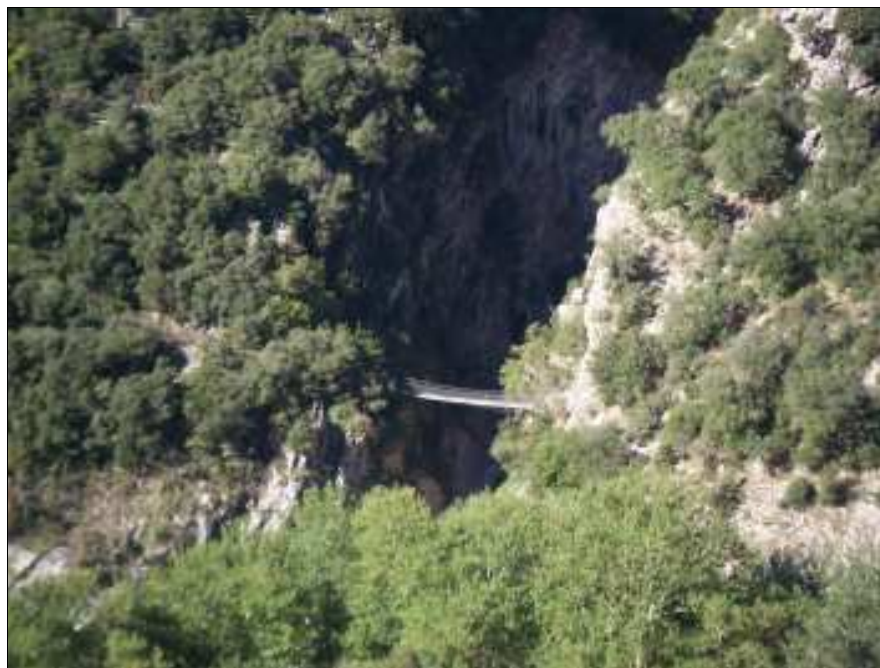
Φωτο. 2. Πανοραμική άποψη του φαραγγιού Πανταβρέχει.