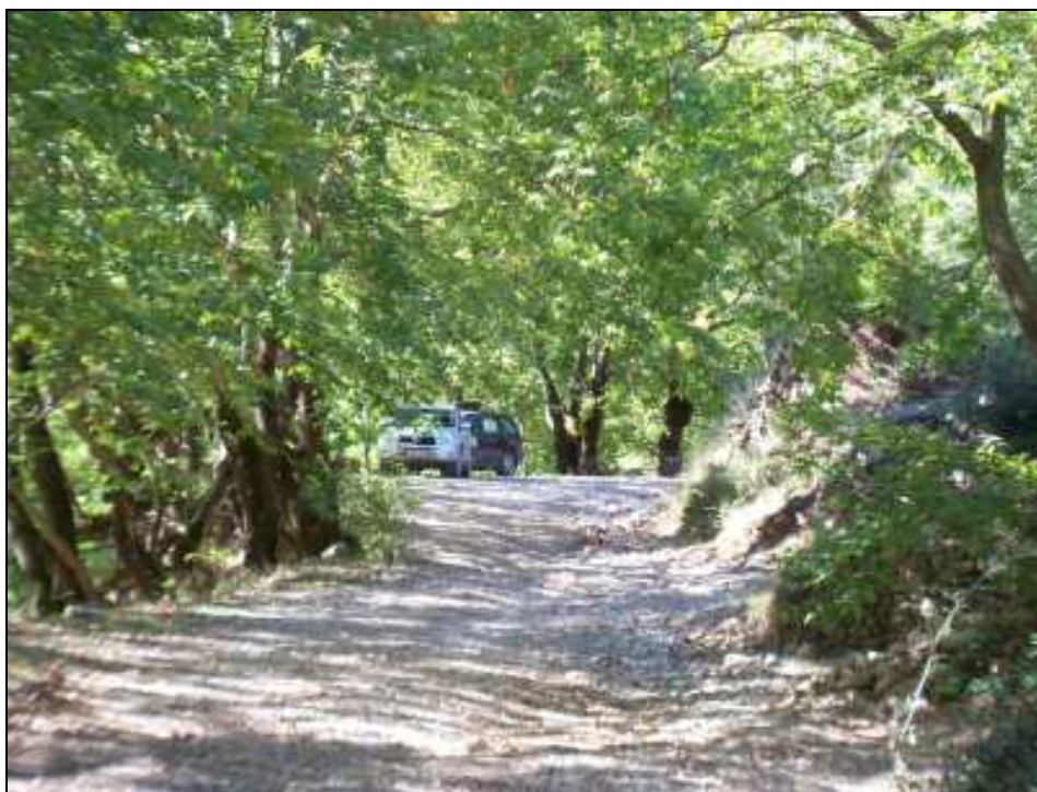
Φωτο 5. Ο δρόμος δίπλα στο πλατανοδάσος όπου θα κατασκευασθεί το κέντρο ενημέρωσης και χώροι στάθμευσης αυτοκινήτων.