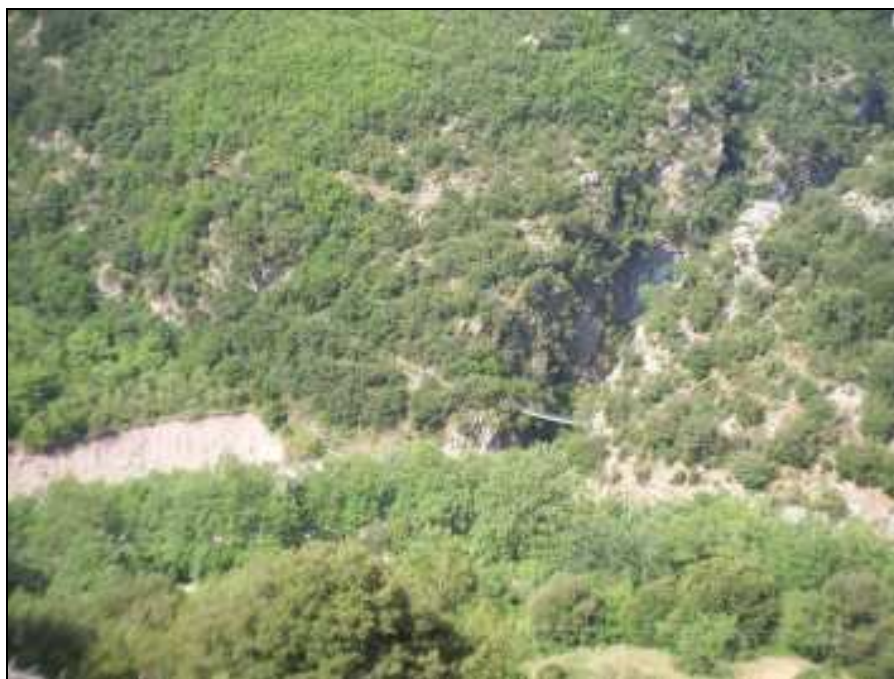
Φωτο. 1. Σε πρώτο πλάνο το πλατανοδάσος όπου θα δημιουργηθεί ο χώρος αναψυχής και στη συνέχεια το φαράγγι Πανταβρέχει με την κρεμαστή γέφυρα στην είσοδο του φαραγγιού.