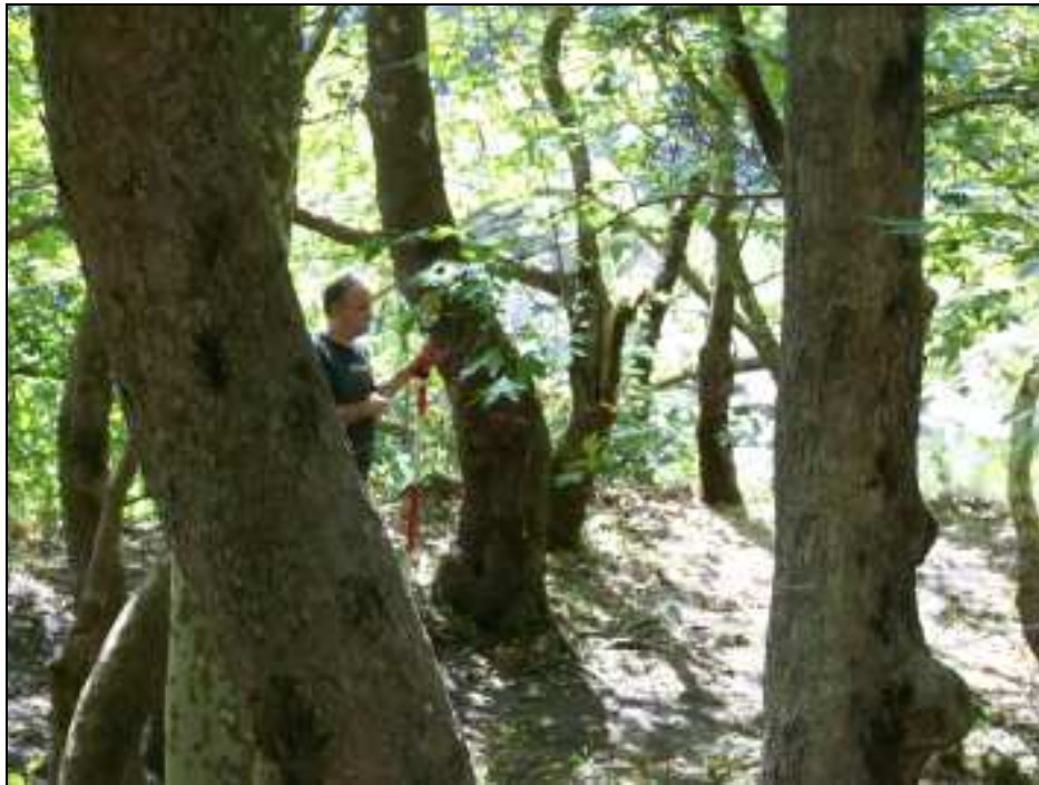
Φωτό 4. Τμήμα του πλατανοδάσους με μεγαλύτερα δένδρα.