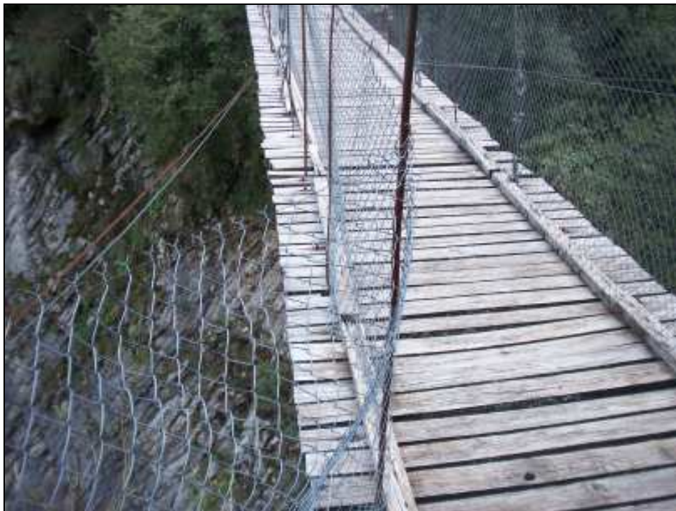
Φωτο. 8. Συρματόσχοινα και ξυλεία της κρεμαστής γέφυρα που χρήζουν αντικατάστασης.