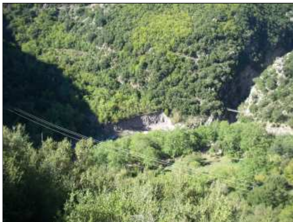
Φωτο. 10. Το τμήμα του μονοπατιού αριστερά της κρεμαστής γέφυρας το οποίο προτείνεται να επισκευασθεί.