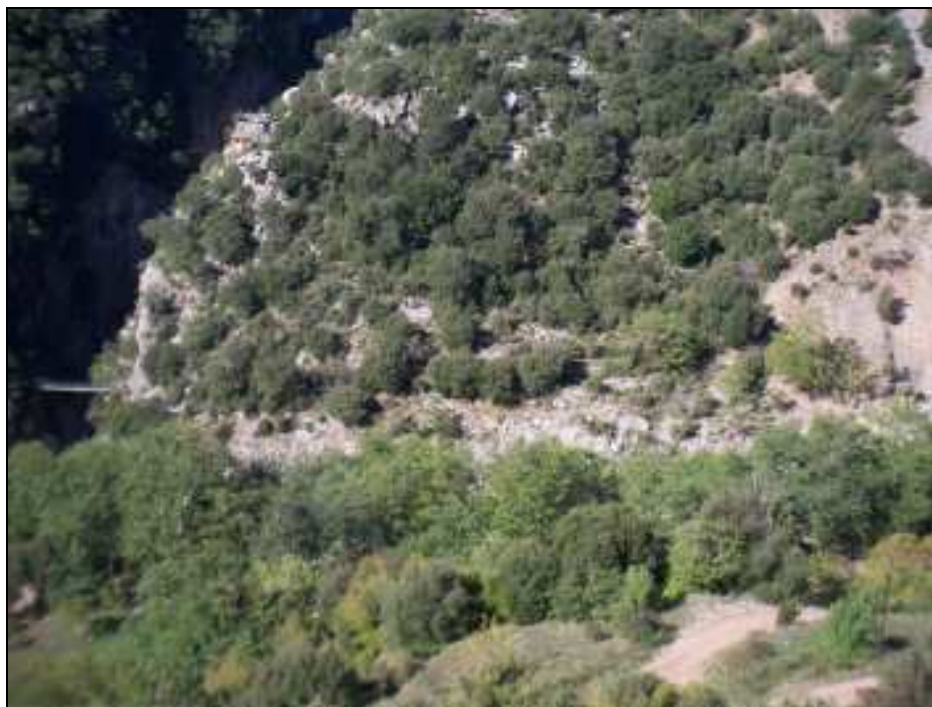
Φωτο. 9. Το μονοπάτι που οδηγεί από το πλατανοδάσος στην κρεμαστή γέφυρα και στη συνέχεια στη άλλη πλευρά στη σιδερένια γέφυρα, το οποίο προτείνεται να επισκευασθεί.