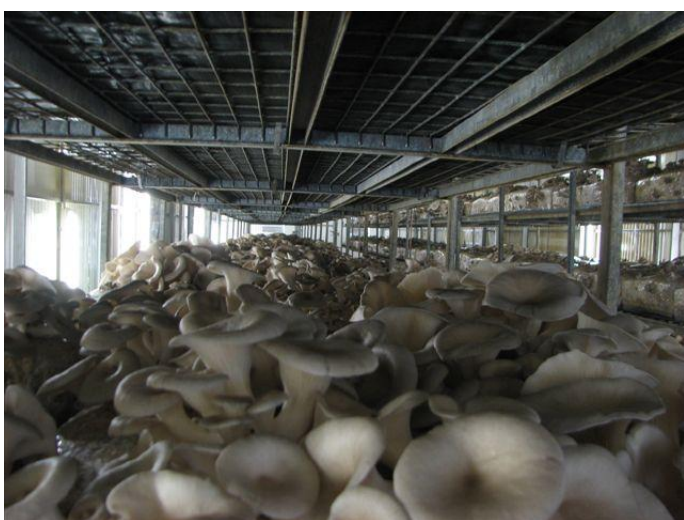
Εικόνες 2,3 Θάλαμοι καλλιέργειαςμανιταριών Pleurotus