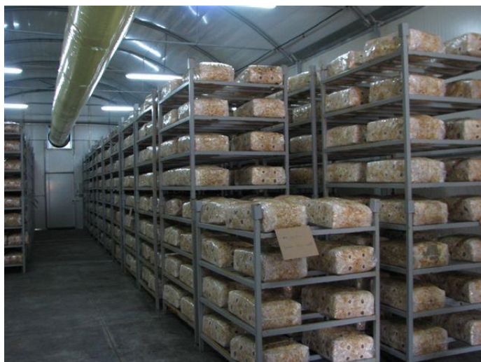
Εικόνα 1 Θάλαμος επώασηςμανιταριών Pleurotus