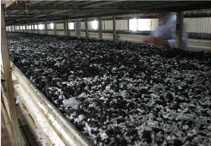
Εικόνα 4 Θάλαμος καλλιέργειας μανιταριών Agaricus