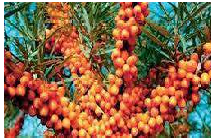
Άννα Φουλίδη Θήβα 4 Απριλίου 2012