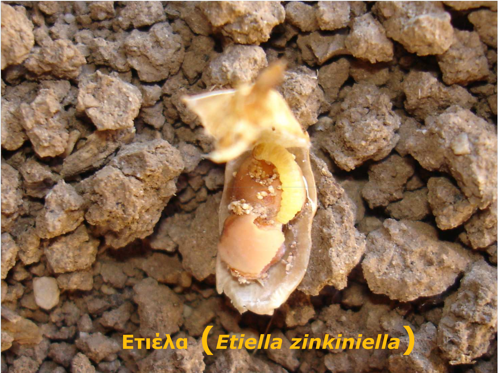
ΕΤΙΈΛα ( Etiella zinkiniella )