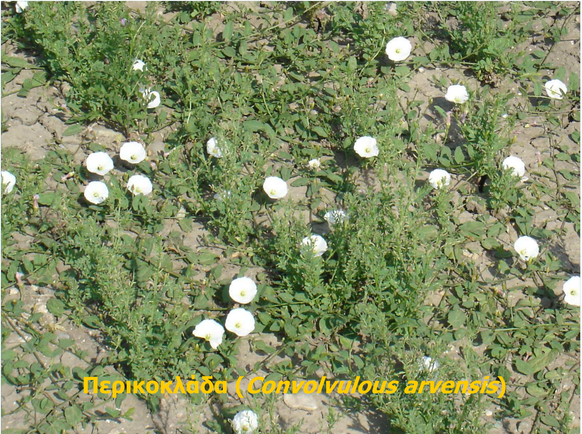
Περικοκλάδα ( Convolvulus arvensis )