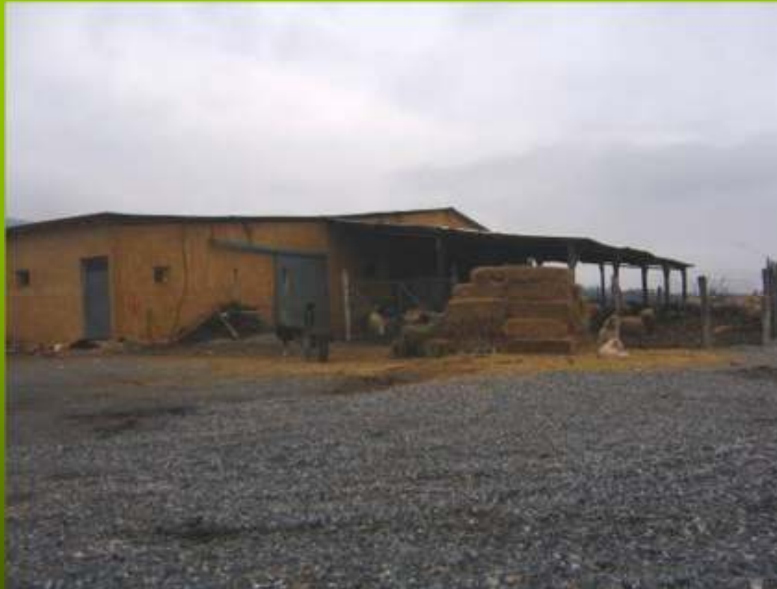
Εγκαταστάσεις κτηνοτροφικών μονάδων (2)