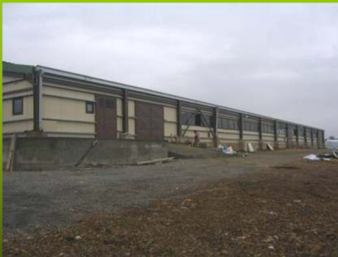
Εγκαταστάσεις κτηνοτροφικών μονάδων (1)