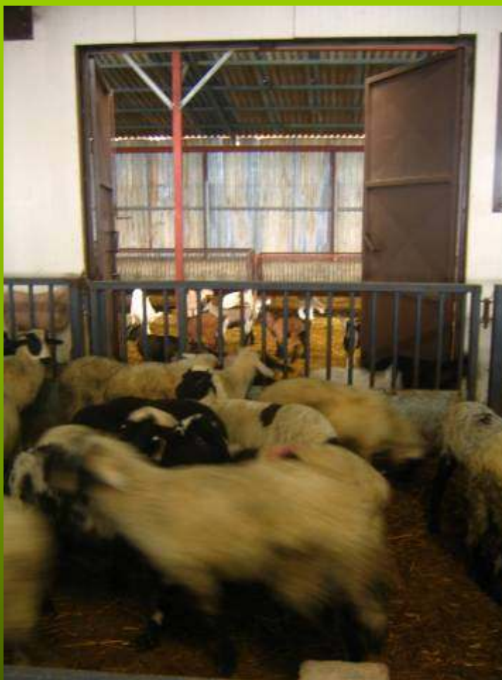
Εγκαταστάσεις κτηνοτροφικών μονάδων (1)