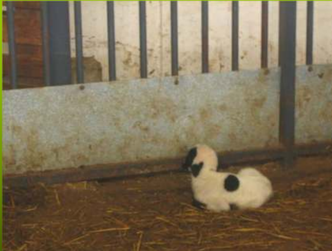
Εγκαταστάσεις κτηνοτροφικών μονάδων (1)