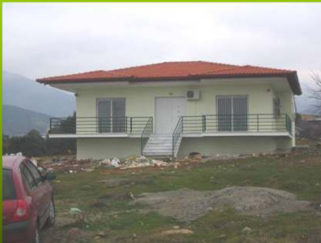
Κτηνιατρική μονάδα (στο κέντρο της έκτασης)