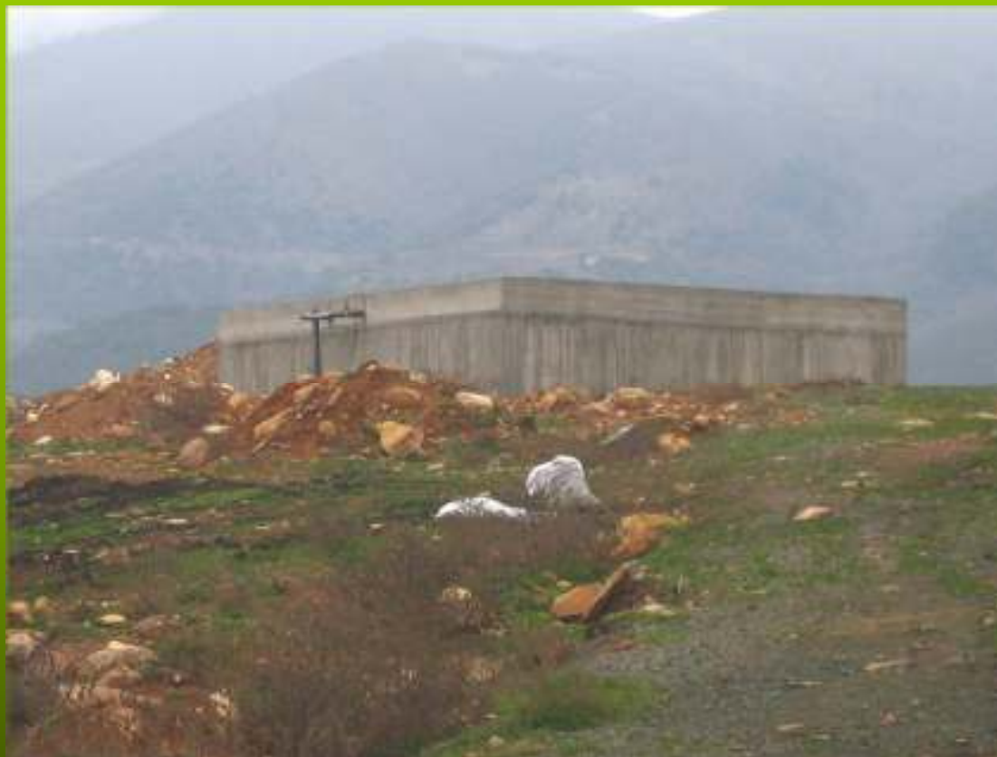
Δεξαμενή ύδρευσης (στο ανώτερο σημείο της έκτασης)