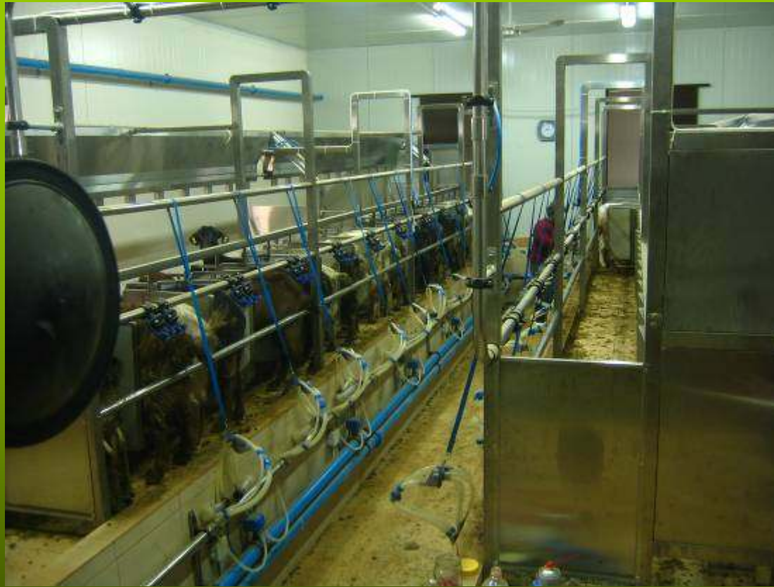
Εγκαταστάσεις κτηνοτροφικών μονάδων (1)