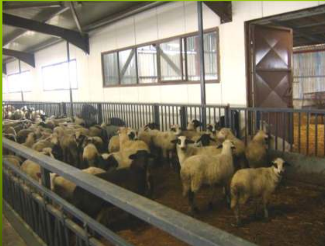
Εγκαταστάσεις κτηνοτροφικών μονάδων (1)