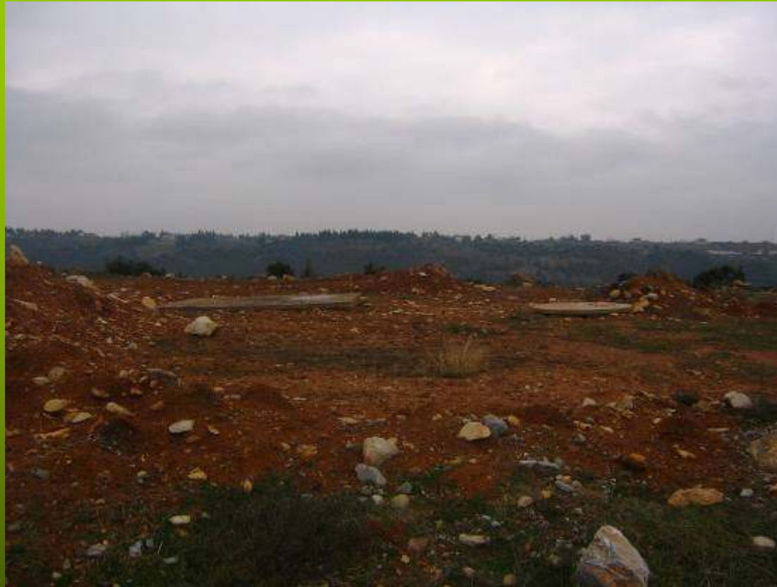
Δεξαμενή λυμάτων (βόθρος) (στο κατώτερο σημείο)