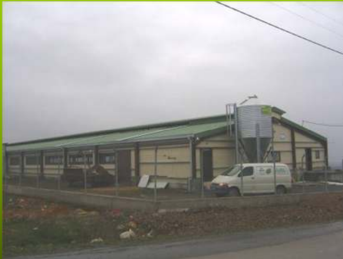
Εγκαταστάσεις κτηνοτροφικών μονάδων (1)