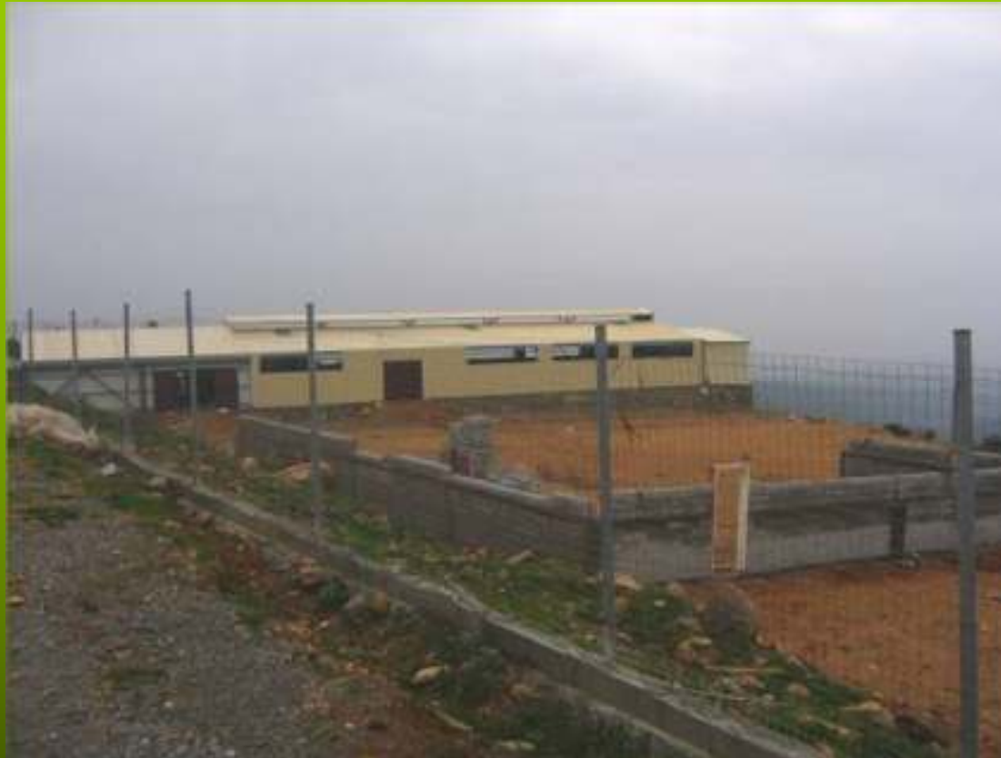
Εγκαταστάσεις κτηνοτροφικών μονάδων (3) – υπό κατασκευή