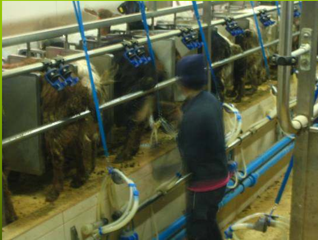
Εγκαταστάσεις κτηνοτροφικών μονάδων (1)